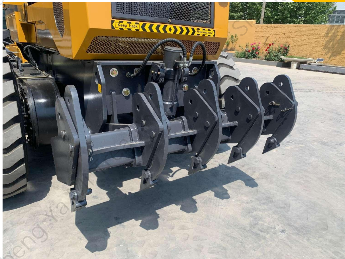
松土器 (后) задний рыхлитель