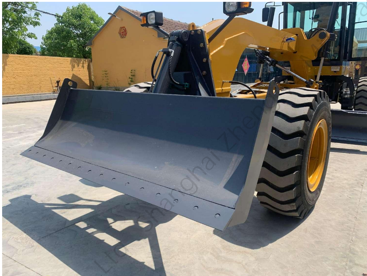
推土铲 (前) передний отвал

需另外配置 необходимо дополнительно установить